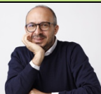
On. Davide Faraone

Deputato della Repubblica, già Sottosegretario al MIUR e al Ministero della Salute; è Presidente di FIA (Fondazione Italiana Autismo). È stato uno dei promotori della prima legge sull'autismo in Italia e della legge sul "Dopo di Noi". Autore del libro "Con gli occhi di Sara. Un padre, una figlia e l'autismo".